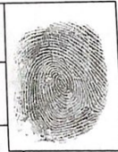
Índice derecho del entrevistado