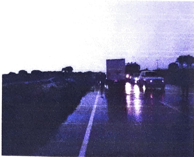
Fotografía No. 3. Plano General: Esta imagen permite observar la posición final del vehículo tipo camioneta particular en relación a la posición del vehículo tipo camioneta furgón en relación a la geometría vial