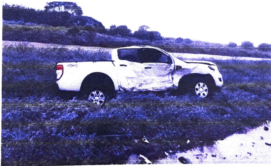
Fotografía No. 4. Primer Plano: Esta imagen permite observar la posición final del vehículo tipo camioneta color blanco de servicio público y los daños sufridos por el mismo

En este punto Indique el destino de los EMP y EF si los hubiere.