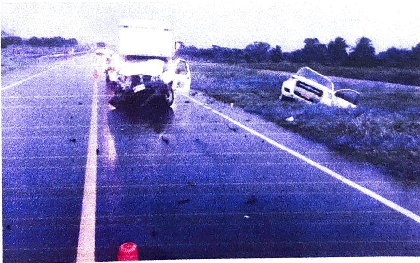
Fotografía no. 2. Plano general: Esta imagen permite observar el lugar de los hechos vía Pueblo Nuevo Valledupar KM 73+900 MTS, se observa la demarcación de la vía y estado de la misma y los elementos material probatorios involucrados en el accidente de tránsito