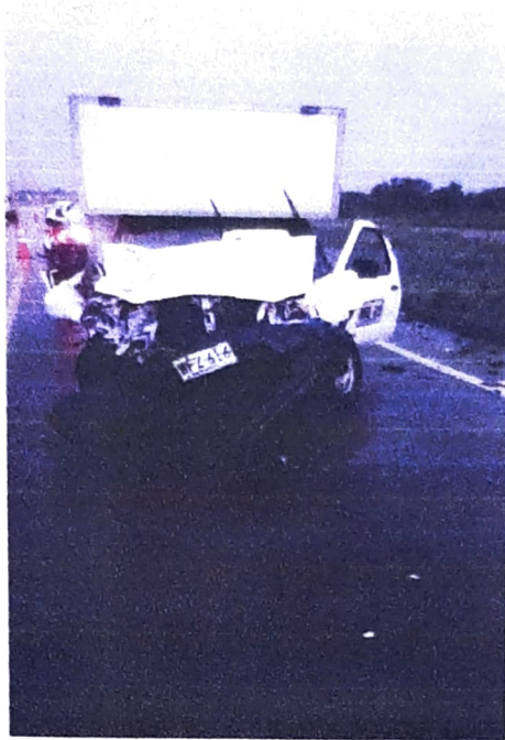
Fotografía No.1 Panorámica: Esta imagen permite observar el lugar de los hechos vía Pueblo Nuevo Valledupar KM 73+900 MTS, se observa la demarcación de la vía y estado de la misma y los elementos material probatorios involucrados en el accidente de tránsito