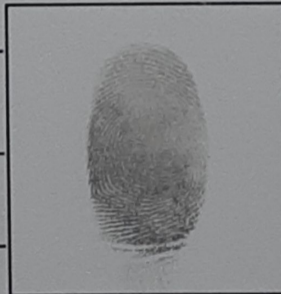
Índice derecho del entrevistado